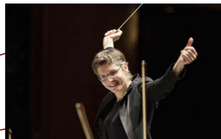
© Elisabeth Fuchs / Erika Meyer

(info@kulturvereinigung.com), bekannt geben.